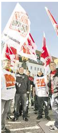
Im öffentlichen Dienst wurde in den vergangenen Wochen gestreikt.

Warum ist also eine LOV erstrebenswert? Es geht um die Steigerung der Leistungsfähigkeit im öffentlichen Dienst durch monetäre Anreize. Leis-